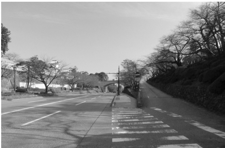
写真 1、2012 年 2 月撮影

兼六園桂坂口からお堀通りの中間に通じる道路下で撮影する。 当時はもっと高い位置から撮影されたようです。