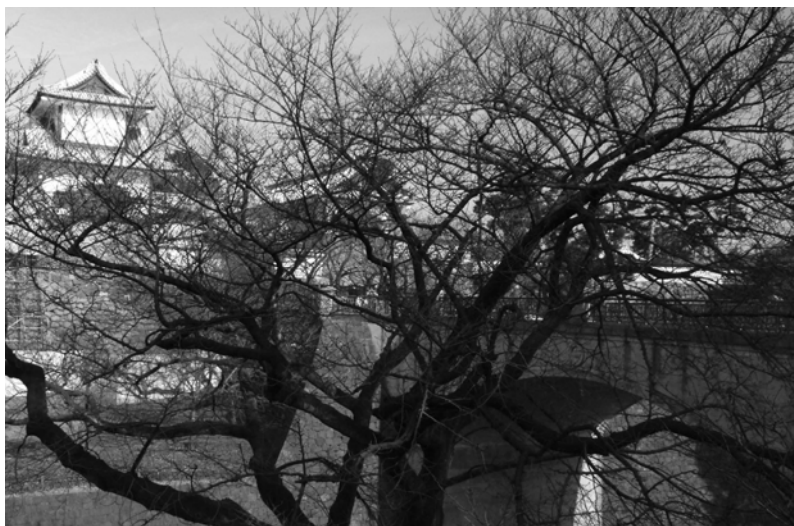
写真 2、2012 年 2 月撮影

兼六園桂坂口からお堀通りの中間へ下る道路途中で撮影する。 撮影位置はここより前方だと考えられます。