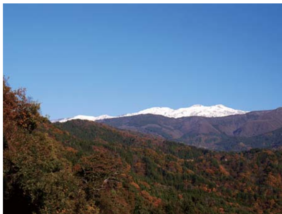
高尾山登山道から見る白山