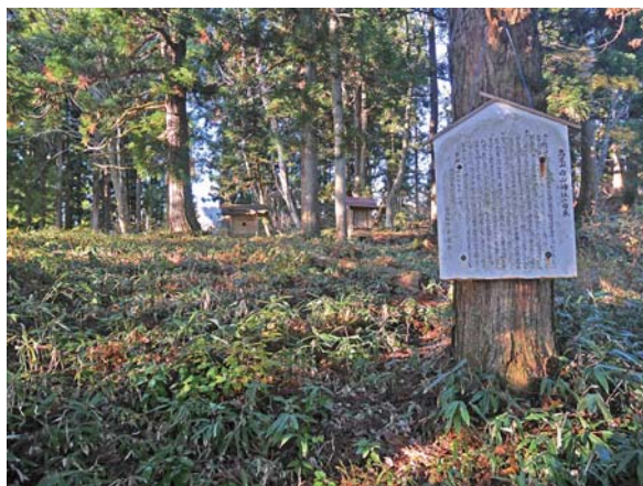
山頂の白山神社奥宮(野津又城主郭)