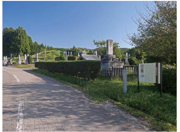
熊坂専修寺跡 (字寺屋敷)