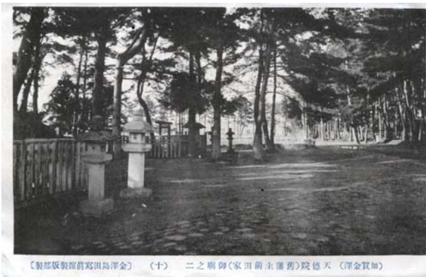
【製版数販館前寫田島洋金】 (十) 二之廟御(家田前主藩舊)院徳天 (洋金貫加)