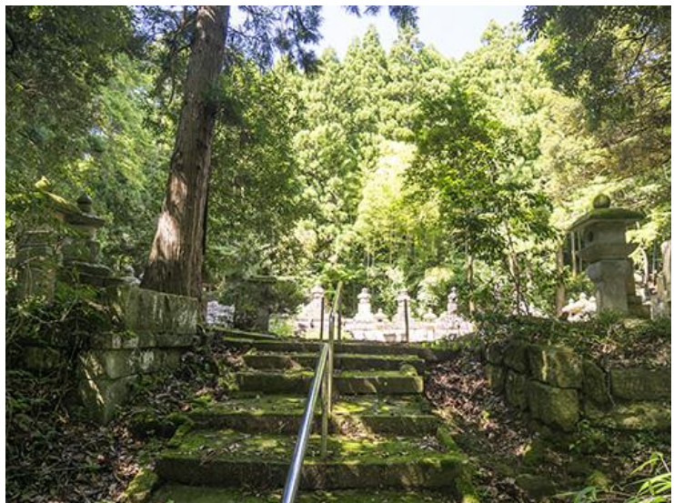
大聖寺前田家墓所（2019年8月撮影）

大聖寺前田家墓所は山ノ下寺院群の南端、曹洞宗実性院にある。万治四年（1661）、二代利明公が初代利治公の墳墓を築造し、移転改名した実性院を菩提寺とした。実性院の裏山墓地の最高所にご当主十四代の墓地があり、隣接した一段低い場所に家老の前田主計家と前田中務家の墓所を設ける。平成二十二年（2010）に加賀市史跡に指定された。